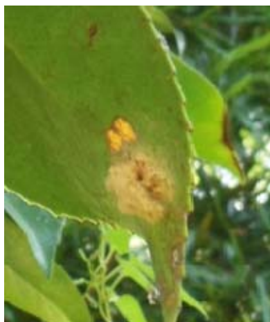
図4 チャドクガ卵塊