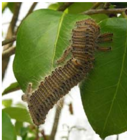
図5 チャドクガ幼虫集団