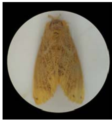
図6 チャドクガ成虫

そこで、チャドクガによる健康被害を未然に防ぐことを目的とし、幼虫の食草として特に好まれるヤブツバキ、サザンカおよびチャノキなどのツバキ科ツバキ属の樹木について、人の往来が多いキャンパス内の通路沿いの分布を調べるとともに、それぞれの樹木について、チャドクガによる食害の痕跡、幼虫発生、脱皮殻および卵塊の有無などを調査し、現状を把握した。結果をもとに、被害軽減策、発生時の対処法および植栽されたツバキ属樹木の管理法等について検討した。