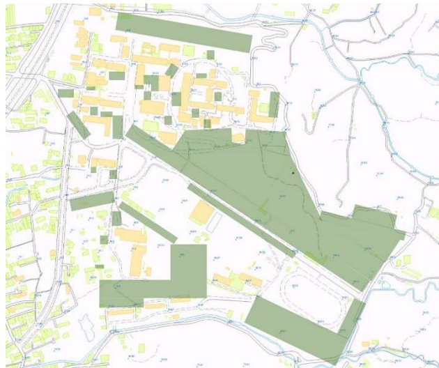
図7 静岡大学静岡キャンパスにおけるツバキ科植物の分布 (地図データは、国土地理院の電子国土 Web システムを使用. 1: 2500)

チャドクガ幼虫の食草とされるキャンパス内のツバキ科の樹木は、ツバキ属（ヤブツバキ、サザンカ、チャノキ）、サカキ属（サカキ） およびヒサカキ属（ヒサカキ） 等が見られた。ツバキ属の樹木は主に庭木並びに圃場に研究用として植栽されていたが、野生化したものも見られた。サカキとヒサカキは自生し、いずれの樹種もキャンパス全域に広く分布していた（図7）。