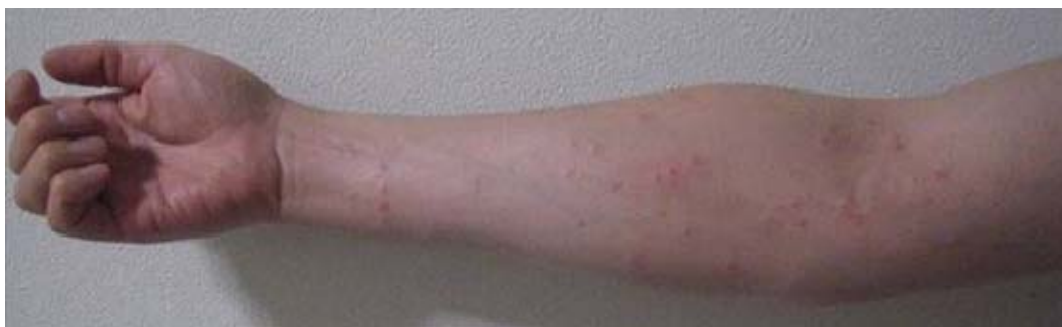
図3 チャドクガ毒針毛による毒蛾皮膚炎

さらに、風などで容易に飛ぶため、虫体に直接触れなくても発生木の近くにいるだけで皮膚炎等の被害を受ける場合もある。強いかゆみを伴う皮膚炎は、7～10日間ほどで症状が緩和されるが、質の高い睡眠が得られないため、体調不良を引き起こしやすく、学生、教職員および外来者への健康被害が懸念された。