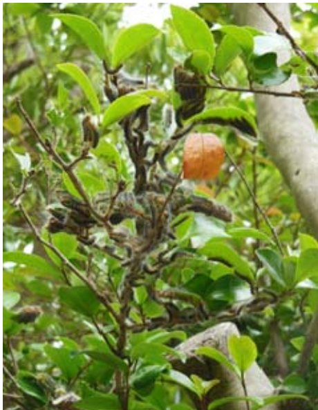
図1 2013年5月中旬の多発生の様子

2013年5月中旬、1世代目の中齢期以降と思われるチャドクガ幼虫がキャンパス内の数カ所の植栽されたヤブツバキとサザンカで発見され、所轄の部局等で速やかに捕殺した（図1～2）。また、8月には2世代目の孵化幼虫の発生がキャンパス内の各地のツバキ属樹木で認められ、2世代目の多発生が予測された。