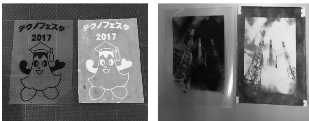
図3 予備実験で現像した作品例(左:手描きイラスト、右:写真データ)