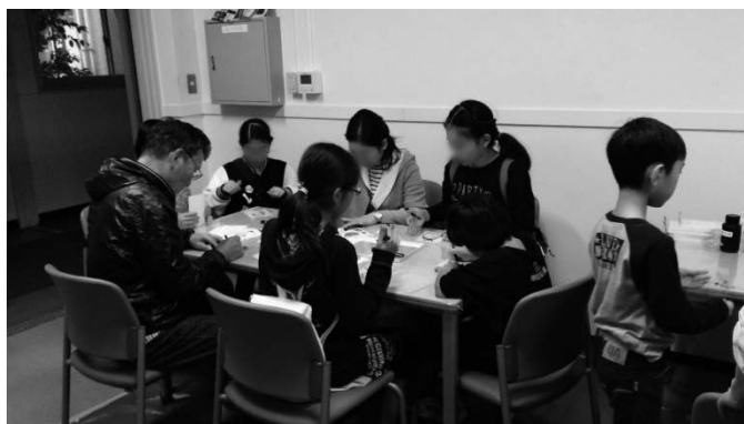
図 4 手描きでネガフィルムを作成する様子

ネガフィルム作成には OHP シートに手描きで絵を描く方法と、手持ちの画像データや写真データをプリンターで印刷する方法の二通りを用意したが、ほとんどの人が手描きでの方法を選んでいった (図 4)。感光剤塗布は安全ため手袋、アームカバー、ゴーグルを着用しての作業となった。また、会場を汚さないよう床と机にシートを敷いた。二日間とも天気は晴れ時々曇りであったため、露光作業は一度屋外に出て日光を利用することになった (図 5)。感光剤が黄色から青色へ徐々に変化していく様子を直接目で見て楽しんでもらった。最後の現像工程では、鮮やかな青と白の絵が浮かび上がると歓声上がるのが多く、目標の 1 つである「感光剤の性質を楽しんで学んでもらうこと」は十分達成された。