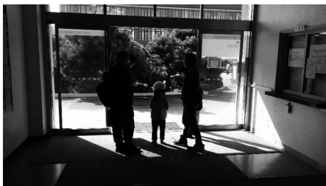
図 5 日光で露光する様子