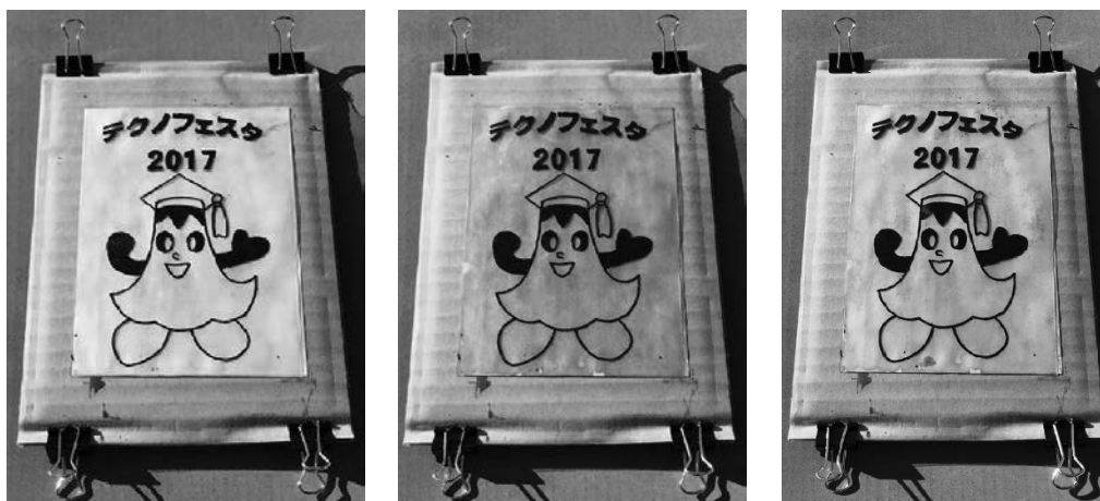
図2 日光での露光による色の変化(左:0分露光、中央:2分露光、右:5分露光)

作製した感光剤を用いて予備実験を行った。まず、OHPシートに油性ペンでイラストを描きネガフィルムとした。次に、白紙に感光剤を塗布し、その上にネガフィルムを重ね、露光した(図2)。露光にかかった時間は、日光で5分程度、ブラックライトで10分程度、蛍光灯で60分程度であった。手描きイラストのような太い線だけでなく、プリンターで出力した写真のような細い線、細かい絵まで現像可能であることが確認できた(図3)。