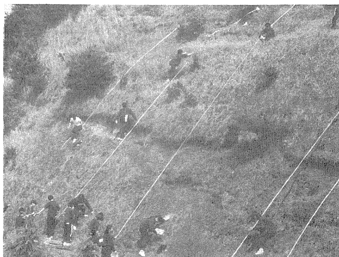
写真 実習1の授業風景

意気込んでの実習であったが、実習1の高の字山の地層観察、生徒の方はよくできていない。プリントに観察のポイントが書いてあるのに読まないのか、理解できないのか、後は時間をとって説明した（地層の厚さの測定や試料の採集はしっかりやれたが）。実習2（花粉の観察）は化石の授業の時までとっておいた方がよかったかもしれない。顕微鏡の精度にもよるが、花粉のこまかいスケッチもできず、未消化に終わった気がした。実習3は乾燥に時間がかかったが、ほぼこちらの意図どおりに実習をおえることができた。実習4は