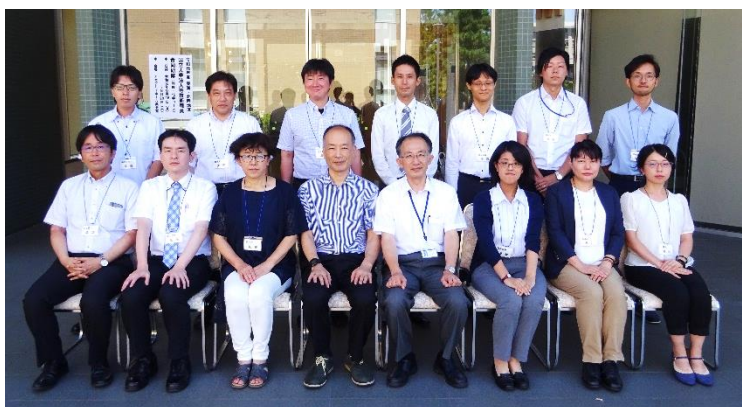
写真1. 受講生集合写真

令和元年度 東海・北陸地区国立大学法人等技術職員合同研修(物理・化学コース)が福井大学にて開催され、技術や知識の習得を目的に当研修に参加したため、その内容を報告する。