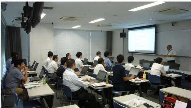
図1 講義を受けている様子