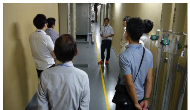
図4 施設見学の様子