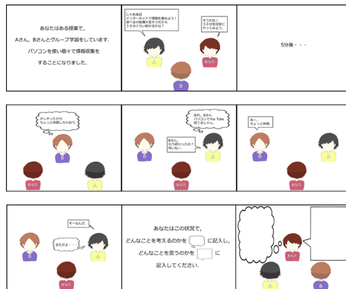
図1 マンガシナリオの例 (Teamwork)

シナリオ中のグループは全て3名で構成され、回答者はその中の一人という設定である。回答者である「あなた」は他の二人の間で起きている問題に直面している。