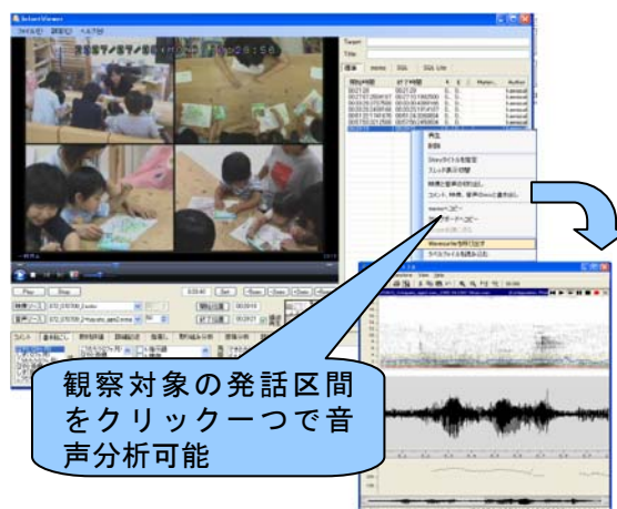
図1：マルチモーダル発話記述システム

開発済みのマルチモーダル行動観察システムを拡張し、音声波形・音声短時間スペクトル・音声パワー・基本周波数といった音声情報を、映像にリンクさせて提示する機構、及び特徴的な箇所を手動でラベリングできる機構を設計・実装した。図1に開発システムのスクリーンショットを示す。