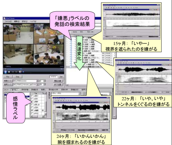
図3：感情ラベルに基づく音声言語獲得過程分析

感情ラベルを手掛かりに、発話意図の観点から事例を整理し、音声言語獲得過程を分析した。前年度開発した音声波形・スペクトル・基本周波数といった音声情報を、映像にリンクさせて提示する機構、及び特徴的な箇所を手動でラベリングできる機構を駆使し、詳細分析を行った。例えば、心的状態が「嫌悪」の発話が、「いや」の一語文から「いやいや」という繰り返し発声、韻律を変化させた強調発声、「いや」以外の語彙による二語文へと変化する過程などが観測できた。図3に具体例を示す。