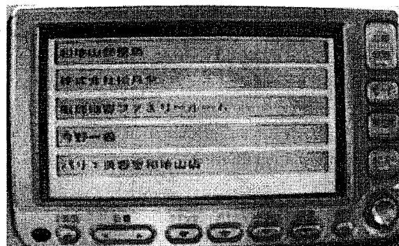
図 2. 到着地登録画面

走行履歴は、エンジンをかけてから止めるまでの 1 走行毎に、車に搭載された PC 内の DB に登録される。登録作業は、到着時に、現在地から近い順に到着地の候補となる。施設が画面内に表示されるので、その中から最も適切なものをユーザが選ぶ形になっている (図 2)。このとき、何時、どこへ、どんなジャンルの施設へ行ったかという基本的な情報の他に、車両信号から、その時に同乗者がいたか、天気はどうだったかなども同時に記録される。そして、これらの情報は到着地別、時間帯別、到着地のジャンル別、天気別、乗車人数別などのテーブルごとに分けられて DB に登録される。