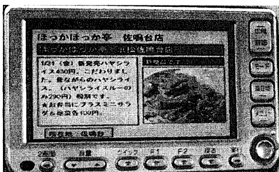
図4. 広告の詳細画面