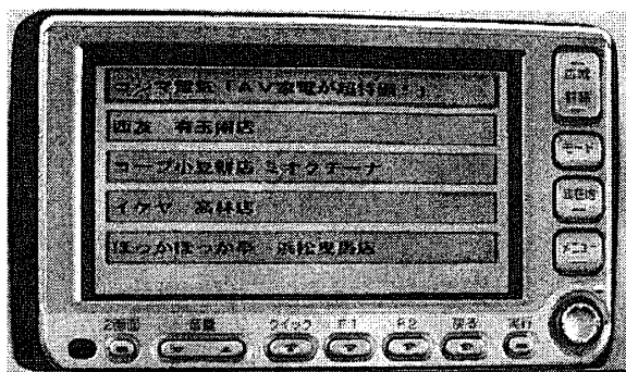
図3. 広告の見出し画面

閲覧履歴は、配信された広告に対するユーザの反応であり、車載 PC 中の DB に記録される。ユーザの反応としては「閲覧」、「無視」、「拒否」の3種類を区別する。「閲覧」は配信されてきた広告の見出し(図3)から、その詳細(図4)を閲覧したことを意味する。「無視」は配信されてきた広告の見出しだけを見て、詳細を確認しなかったことを意味する。「拒否」は配信されてきた広告の見出し、または詳細をみて、ユーザがその広告、またはその広告のジャンルは見たくない判断したことを意味する。この3種類の行動にはそれぞれポイントが付けられており、閲覧、無視、拒否と広告に対して好ましい反応ほど高ポイントが与えられる。広告の施設、ジャンルごとにそのポイントの平均値がDBに記録される。このポイントが高いほどユーザの関心・要求が高いと判断する。これも走行履歴と同様に、時間帯別、曜日別、天気別などのテーブルごとに分けられて保存される。