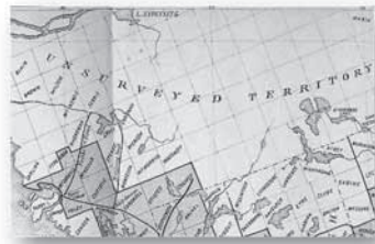
地図が無い土地が広がる1871年当時のオンタリオ州パリーサウンド地区北部

1871年にオンタリオ州マスコーカ地区のブレイスブリッジ（Bracebridge）で出版されたマスコーカ地区とパリーサウンド地区についての本（MCMURRAY 1871）がある。この頃の両地区は、土地の無償供与で広く移民を募っていて、開拓地無償供与地区（the free grant districts）と呼ばれている。当時のオンタリオ州では、アメリカ合衆国のホームステッド法にな