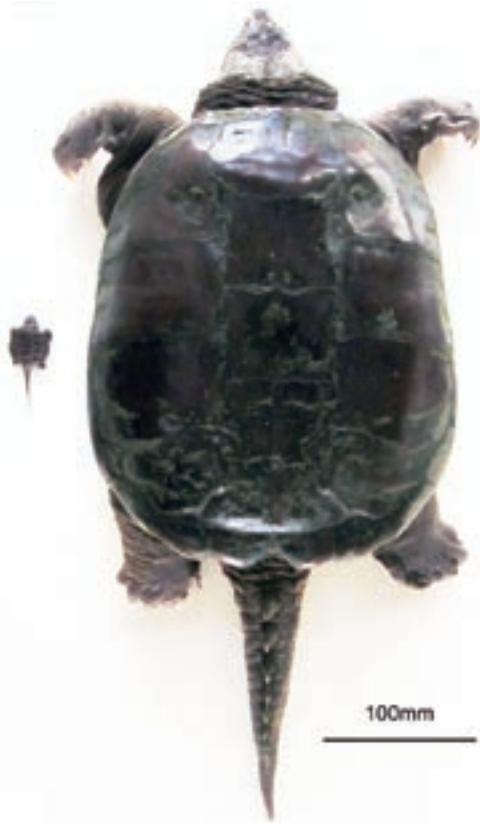
Fig. 2 Chelydra serpentina . Left, juvenile (No. 6) ; right, adult male (No.2).

特定外来生物に指定されたカミツキガメの輸入と販売、繁殖は行われていない。そのため、幼体と判断された2個体は、野外で繁殖したものと判断した。本調査では、野外において卵や孵化後に残る卵殻は確認されなかった。しかし、千葉県佐倉市では、カミツキガメの卵が野外で確認されており、2008年6月12日には印旛沼に流れ込む高崎川の土手で、1クラッチ46個のカミツキガメの卵が発見され、その巣では9月19日から21日の間に13個体の幼体