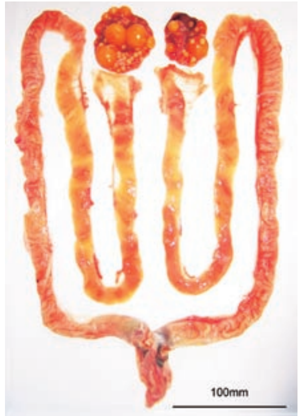
Fig. 3 Ovarian follicles and oviducts of the female. Oviduct length, 945 mm (left) ; 863 mm (right).

特定外来生物に指定されたカミツキガメの輸入と販売、繁殖は行われていない。そのため、幼体と判断された2個体は、野外で繁殖したものと判断した。本調査では、野外において卵や孵化後に残る卵殻は確認されなかった。しかし、千葉県佐倉市では、カミツキガメの卵が野外で確認されており、2008年6月12日には印旛沼に流れ込む高崎川の土手で、1クラッチ46個のカミツキガメの卵が発見され、その巣では9月19日から21日の間に13個体の幼体