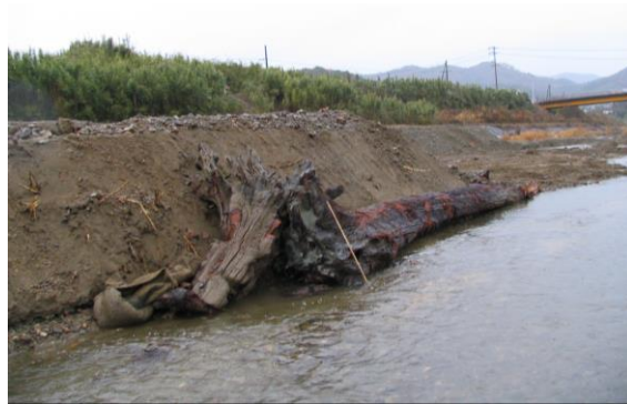
図 1 都田川から出土した埋もれ木