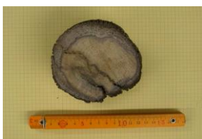
図 2 都田川埋もれ木 No. 1

供試材料は、都田川護岸工事現場河床の青灰色の泥層から出土した約 3,500 年前 2) の「埋もれ木」3 体を用いた。持ち込まれた時の大きさは、直径 9 cm 程度の丸太及びブロック状のもので、何れも樹皮が残っていた。なお、試験体番号と供試材料の写真を図 2～4 に示す。