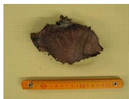
図 3 都田川埋もれ木 No. 2