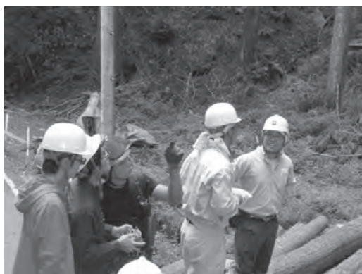
図5 集材作業の見学・体験

企業訪問では、様々な林業の現場見学を中心とし、案内役を各企業の担当者をお願いしている。学生の引率監督のため、静岡大学からも職員が同行する。訪問先の企業では、実際の現場に出向いて様々な作業と働いている人の様子を見学する。また集材機械のラジコン操作など、簡単な体験などもできるようにお願いしている（図5）。そして学生たちとの意見交換や質疑応答にも対応してもらい、業界への興味や知識を深めてもらえるような時間も確保している。