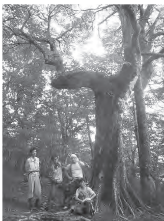
図3 防鹿柵資材運搬