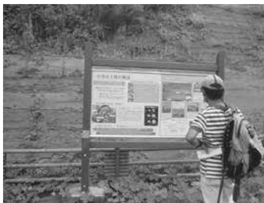
図1 宇刈里山公園にて地層の案内板をみる。

この露頭は、白井(2009)で記載がある露頭である。植生が覆いだしているものの、下部に大日層の貝化石密集層が見られた。この部分は石灰分が硬く固結し、ノジュールとなっていた。上位の宇刈層との境界は残念ながら観察できないが、上部は極細粒砂からシルトが重なり、より深い層相に変化