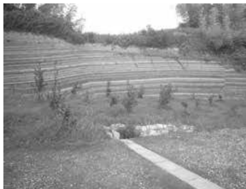
図3 杉谷の砂泥互層。