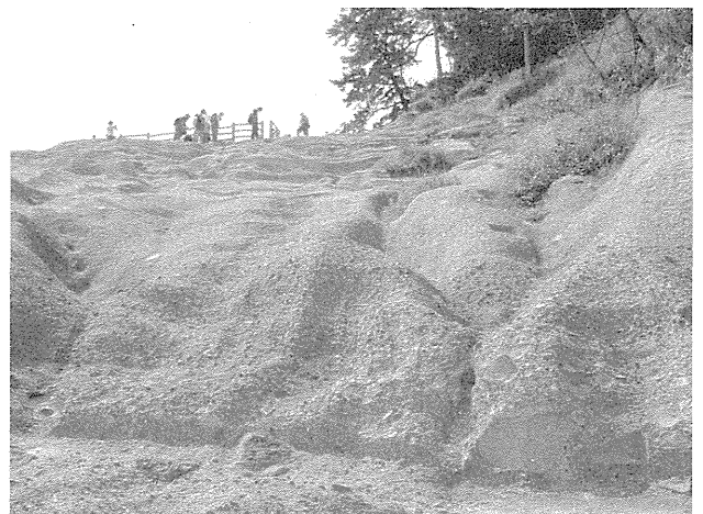
図4：西伊豆町 堂ヶ島（白浜層群）。