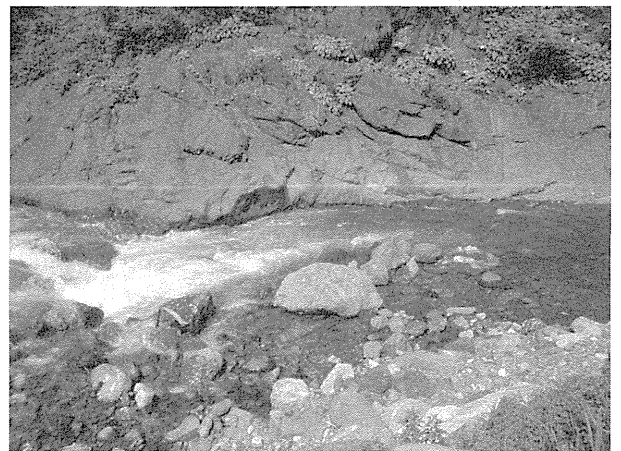
図6. 橋立ひすい峡。青海川硬玉産地の川原の様子。真砂橋から上流方向477mの区間が国の天然記念物となっている。

(2) 橋立ひすい峡(青海川硬玉産地)：工場から10分程青海川沿いに上り、橋立ひすい峡の真砂橋を越えて駐車場に車を止めた。真砂橋から上流方向477mの区間が国の天然記念物に指定されている。橋から5分位歩くとひすい峡の様子とひすいの位置を示す看板がある。河原に下りてひすいを探した(図6)。河川に残るひすい輝石の巨岩の多くは白色で緑色や紫色の縞模様があった。真砂橋から下流は採取可能なのでひすいを含む白色の石を1時間余り探した。