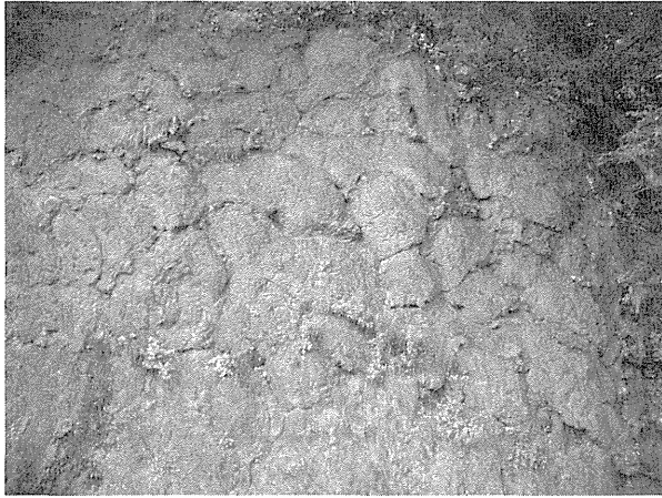
図3. 下方に垂れ下がる枕状溶岩。

遊歩道を8分位登ると崖の真上にある「日本最大級の枕状溶岩」(説明書による)に出る。この枕状溶岩は直径12 mもあり、放射状の柱状節理を持つ巨大なピローローブであった (図4)。落下防止柵がありよく観察できなかったが、周囲には枕状溶岩、枕状溶岩の破片、玄武岩質柱状節理などが見られた。