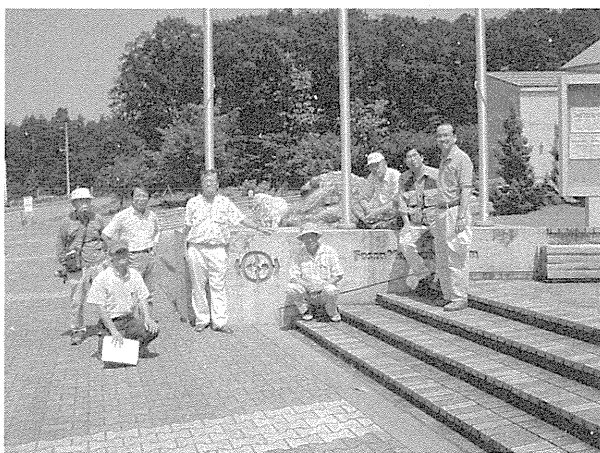
図2. フォッサマグナミュージアムにて。