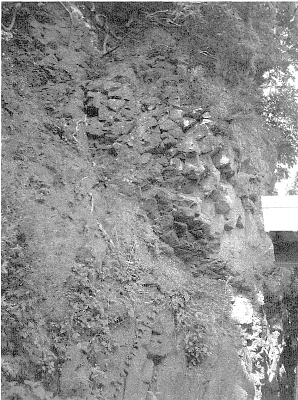
図4. 柱状節理を含む巨大なピローローブ (枕状溶岩?)。

ピローローブからさらに10分進むと糸魚川—静岡構造線の断層露頭がある (図5)。幅約1.5 mの白～褐色の層は、断層が活動するごとに岩石が粉碎された断層粘土である。粘土はやや水分を含んでもろいが、岩石のK-Ar法では、向かって左手 (西側) は暗緑色の変斑レイ岩で2億6,000万年以前、向かって右手 (東側) は暗褐色の安山岩で1,600万年前であるという。4色に分かれた断層粘土からは、安山岩 (上盤) が変斑レイ岩 (下盤) の下方に移動した正断層であることがわかるという。