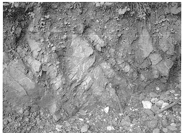
図7. 瀬野田のペルム紀深海堆積物。玄武岩と黒色泥岩の互層が赤色チャート・石灰岩を挟み、小さな断層によって複雑に接したメランジュ。

(3) 瀬野田の小滝コンプレックス：橋立から青海川を下って姫川に戻り、55分で小滝川発電所に着いた。発電所手前のトンネルの左崖では玄武岩と黒色泥岩の互層が赤色チャート・石灰岩を挟み、小さな断層によって複雑に接していた。これらは、およそ2億6,000万年前の北中国東縁の海溝で堆積したペルム紀の深海堆積物の付加体で、黒色泥岩基質メランジュを頻繁に含む小滝コンプレックスであるという(図7)。