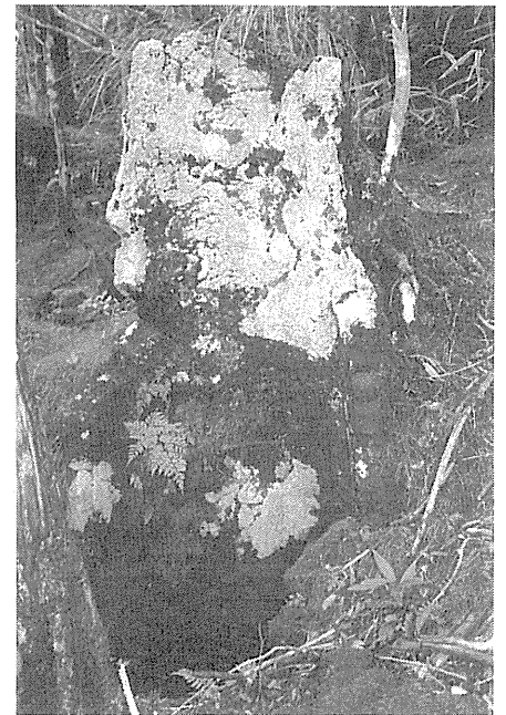
図4. 井戸型溶岩樹型と不動岩溶岩樹型.