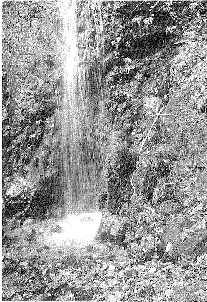
図1. 不動の滝 (小坂).