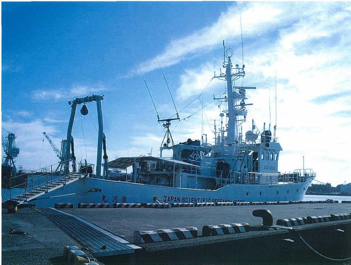
1. 小川港（焼津市）に停泊中の静岡県水産試験場所属調査船駿河丸（2004年9月）.