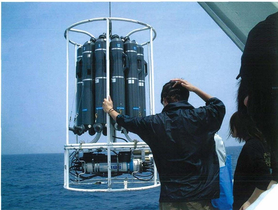
2. 駿河丸における採水器の海中投入の様子（2002年5月）.