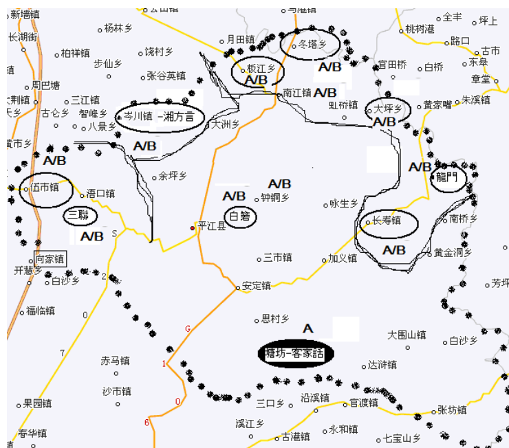
図 2 平江方言に見られる3人称の分布

平江城関方言のこの2つの3人称の由来について、仮説としては、平江城関方言における3人称は恐らく元々はA系しかなく、その後、官話の影響でB系を取り入れ、そこで同義衝突を起こし、両者を使い分けるようになったものと考えられる。この2つの3人称の発生やその他の関係については更なる考察が必要である。