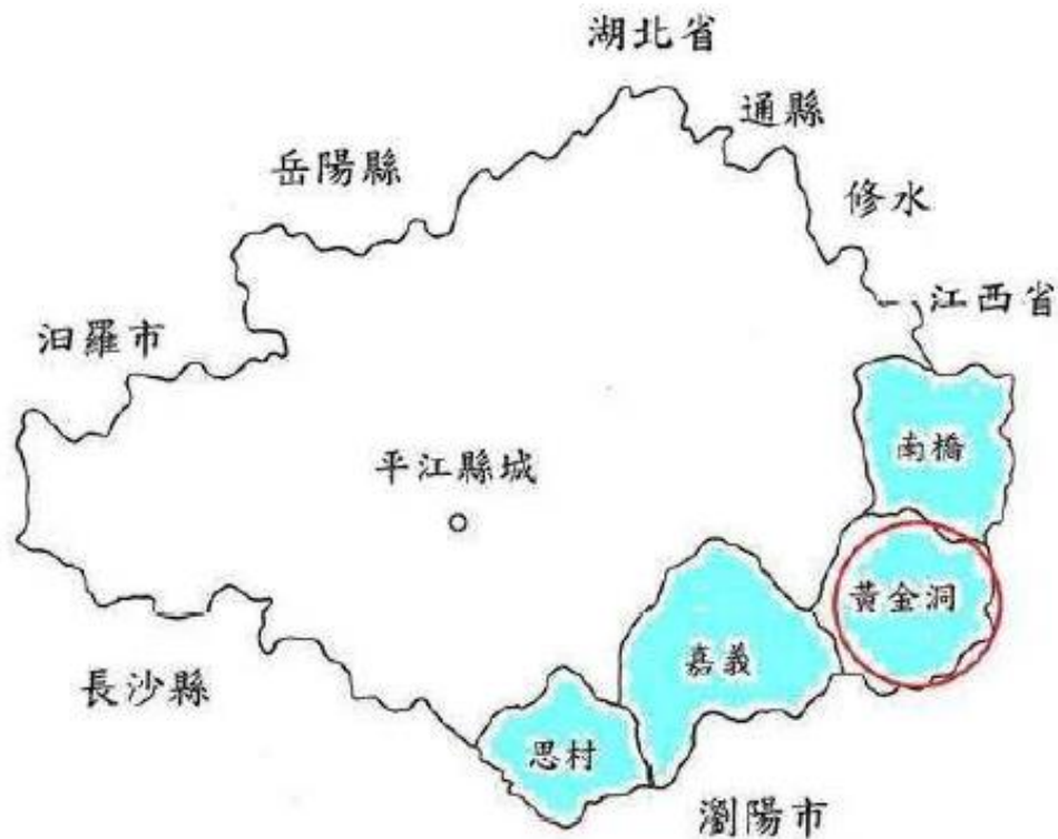
图表 2 郭婉宜（2012:13）所示平江县内客家方言分布图

将郭婉宜（2012）显示的平江客家话地域跟前述陈晖·鲍厚星(2007)所说进行比较会发现，虽然在地名方面有小许差异，但在地图上的表现大致一致。