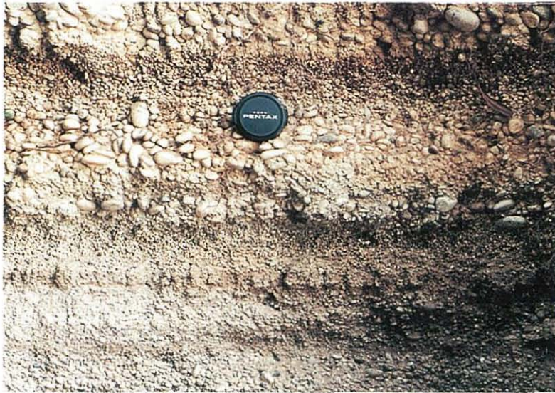
写真4. 牧の原礫層の海浜成相 白羽④