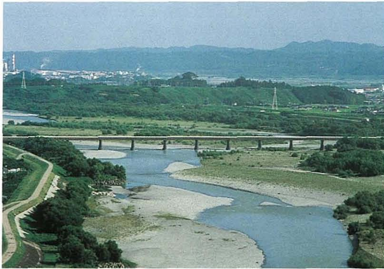
写真1. 大井川右岸の河岸段丘 起伏のある遠景が高尾山、その 手前の平坦面が牧の原台地。 中景の平坦な地形は低位段丘 (牛尾段丘)、手前は大井川。 居林①より南を望む。