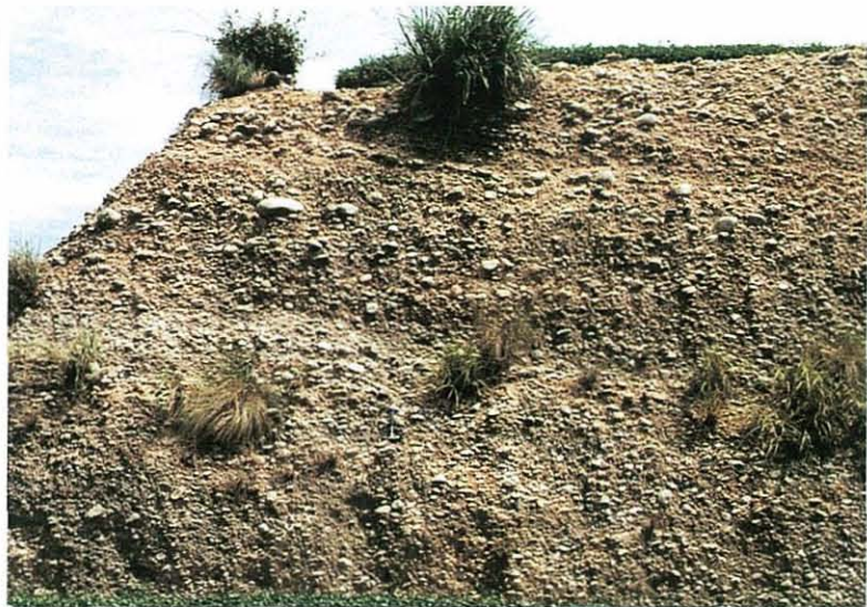
写真2. 牧の原礫層 菅山原②