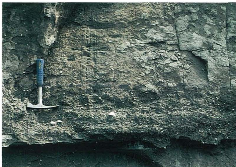
写真6. 古谷泥層 貝化石を多産する。 新田⑥