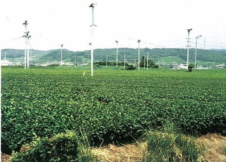
写真3. 御前崎台地 半島先端の方向(左)へ幾分高 くなっている。 遠渡③