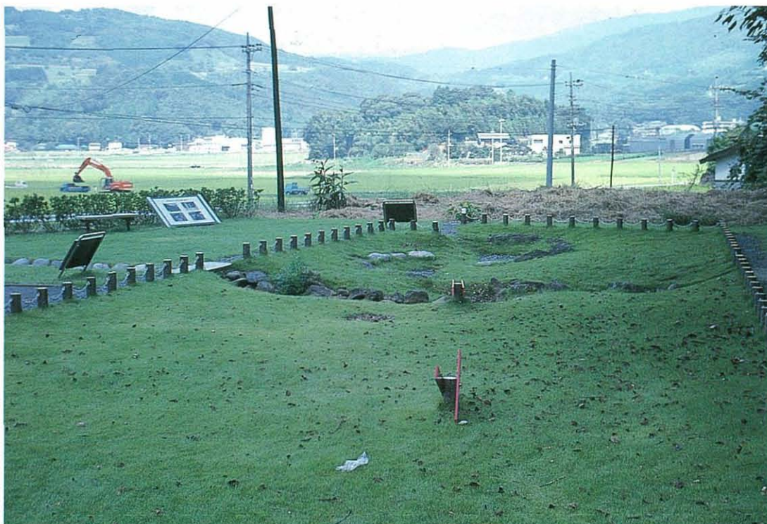
写真3. 丹那断層とその北方への延長方向。