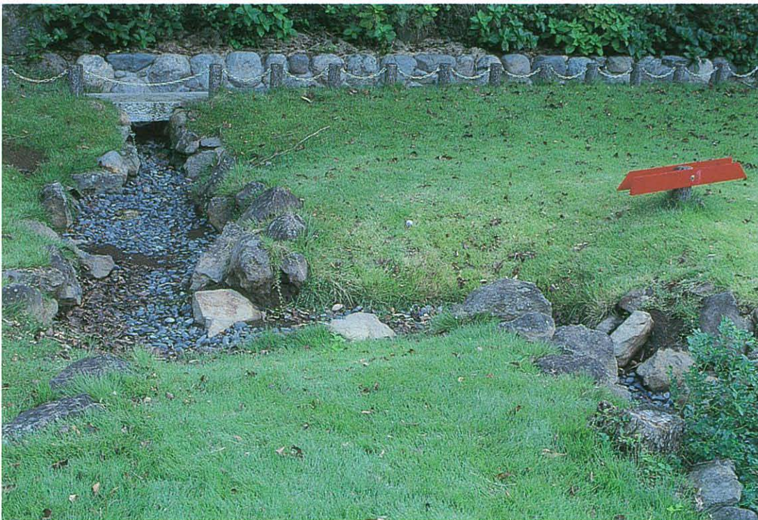
写真2. 写真1の円形の塵捨場の南側の水路も断層によってずれた。「左横ずれ断層」の跡を残している。