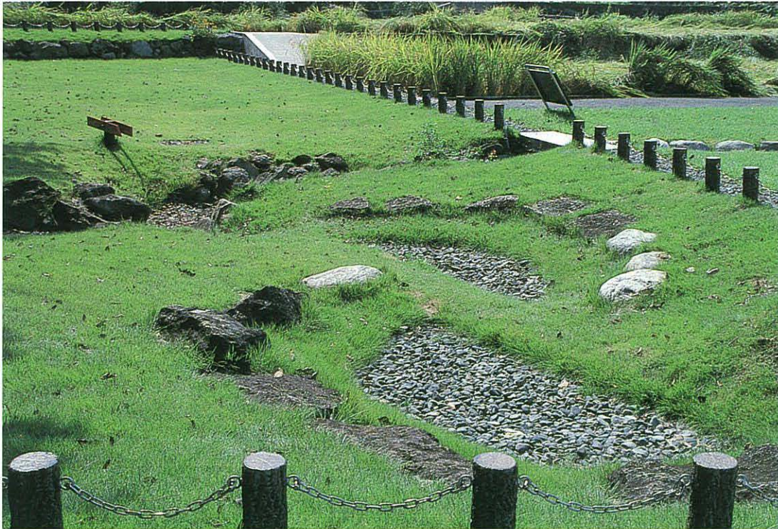
写真1. 断層によってずれた円形の塵捨場。