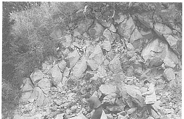
写真2 カワゴ平単成火山の軽石状流紋岩質溶岩流 (図1の地点2)