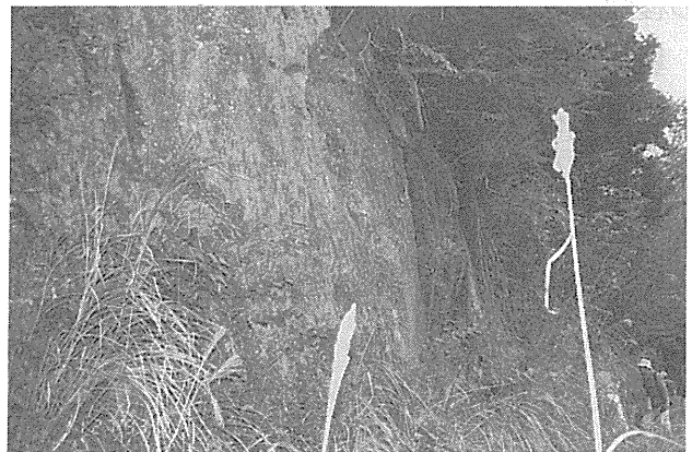
写真1 カワゴ平単成火山の火砕流堆積物 (図1の地点1)

次の見学地へ向かうため、車をUターンさせ県道に出る。国士峠方面に走らせるが、目的地には駐車スペースがないということで、途中車を置き