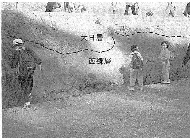
写真1 第2露頭 西郷層に大日層が不整合で重なる (写真中の補助線は両層の境界)