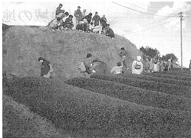
写真2 第5露頭 大日層からの化石採集