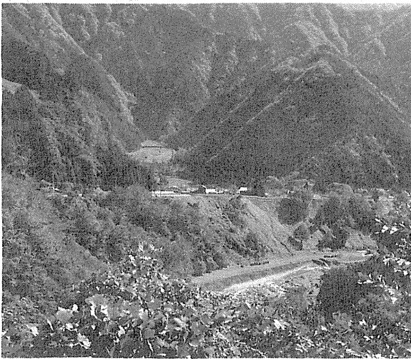
写真2 河岸段丘(新田)

大谷崩から押し出された崩壊物は、所々に河岸段丘を形成している。その一つが、「新田」である。私たちは、大谷崩から県道へ引き返す途中で、それを観察できた。