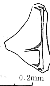
図 3 代表的な AT 起源火山ガラスのスケッチ

記⑥までの処理の終えた残液を 1/2 mm、200 mesh* のふるいにとおし、それぞれのふるいに残った砂粒を乾燥させ秤量し、砂粒の鉱物組成をしらべるとき求めたふるい法による砂粒の粒度組成の値と比較し、誤差を少なくするよう努力した。こうして求めた粒度分析の結果を図 5 に示す (京見塚、広野、鶴が池北の試料は調査対象の地層のすべてを含んでいる)。