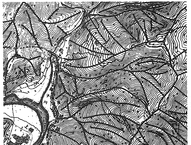
第1図 地形図に稜線 谷線を入れる

地図を張り終わったら、よく乾燥するのを待って、朱鉛筆などで稜線、谷線を引く。これが終わったら、台の足さんをねらって、地図の上から、3cm内外のくぎを、約10cm間隔にうちつける。このくぎは、紙粘土が台から脱落するのをふせぐためであるから、くぎの頭を1cm以上だ