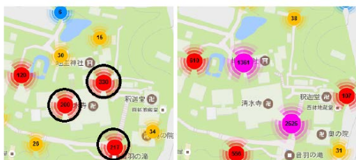
(a) 自撮り写真 (b) 自撮り以外の写真

この自撮り写真とそれ以外の写真の撮影位置を比べると、異なっている事が分かる(論文中図 3、本報告書にも引用)。またこれに基づいて、平均的な観光ルートを導出した(論文中図 8、本報告書にも引用)。これにより、自撮り旅行というコンテキストにおいて、訪れるべき観光ルートと、自撮り写真を撮影すべき場所を明らかにすることができる。