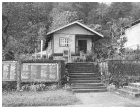
写真1 キアンガン平和資料館

戦後、フィリピンは、再びアメリカの統治下に置かれたが、1946年7月4日、再独立を果たし、フィリピン共和国（第三共和政）が誕生した。しかし、首都のマニラから地理的に遠く離れたところに位置し、さらに地形的