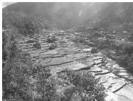
写真2 ハパオ村の棚田