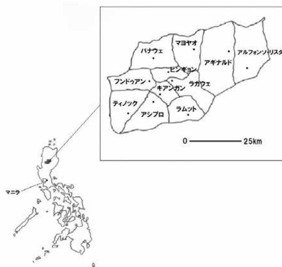
図1 イフガオ州の位置

2015年のイフガオ州の人口は20万2802人で、コルディリエラ特別行政区の総人口の約12%、フィリピンの総人口の約0.2%にあたる。イフガオ州は11の郡（municipality） 3) で構成