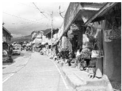
写真7 バナウエの土産物店