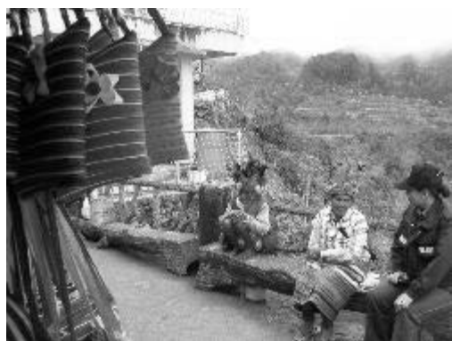
写真6 民族衣装を身にまとう女性たち