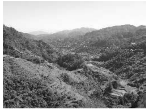
写真5 バナウエの棚田

バナウエには、観光者向けの土産物店も多くあり、とくに多くの観光者たちが訪れる展望台付近には、多くの土産物店が軒を連ねている。ここでは、木彫り彫刻、イカット織りの布やその加工品、網カゴのほかにも、Tシャツ、キーホルダー、アクセサリ、絵葉書などが販売されている。値段は、例えば、2017年3月時点で、イカット織りの布を加工してつくった小さなカバンは、100フィリピン・ペソの値段で