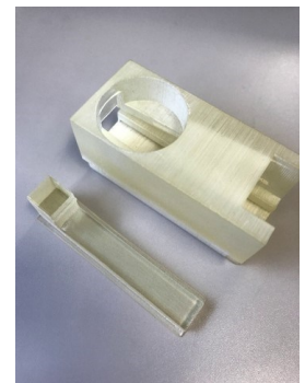
図4 指型アタッチメント