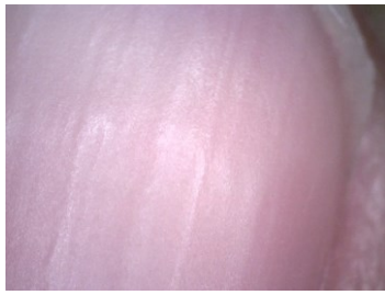
図 1 爪表面画像(圧迫前)