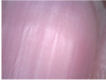
図 2 爪表面画像(圧迫後)

る。反応性充血とは、それらの血流を圧力等で途絶させた後に圧迫を解いた際には、一時的に血管の拡張が起こり、血流が増加して皮膚が赤くなる現象のことである[6]。