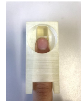
図6 指型とアタッチメントによる固定