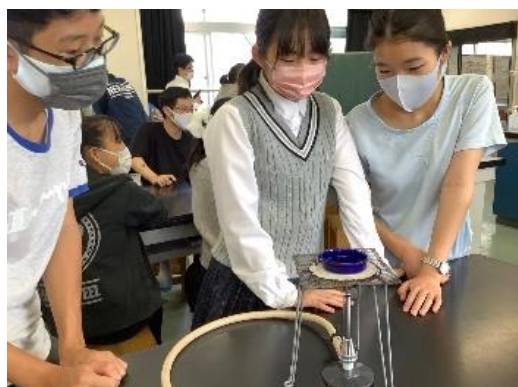
図4 未知の物質を取り出そうと実験するようす

生徒たちの対話からは、何らかの気体が発生したという客観性を手がかりに、探究心を高めているようすが見られた。また温度と状態の関係に気づき、状態変化があり得るのか、別の物質に変化した可能性があるのかという2つの点に疑問をもち始めた。