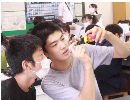
図2 ゆらゆら人形の構造を考えるようす