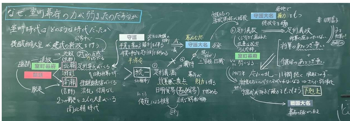
図2 第4時全体共有板書内容