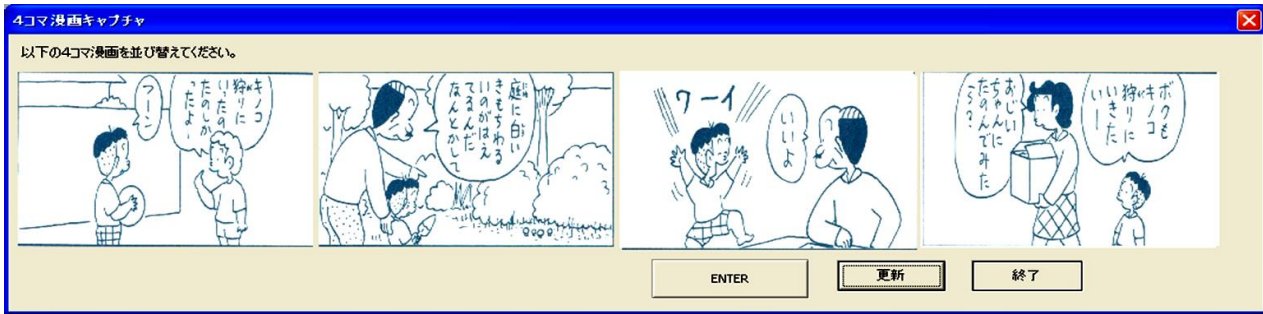
図 4. 4 コマ漫画 CAPTCHA の認証画面例

(出展：左から1番目の図：文献[10]の p.25 の 4 コマ漫画の 1 コマ目，2 番目の図：同，p.25 の 4 コマ目，3 番目の図：同，p.25 の 3 コマ目，4 番目の図：同，p.25 の 2 コマ目)