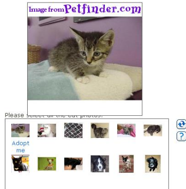
図 2. Asirra の認証画面例

には判別できるが機械には判別がほぼ不可能である問題を作成することができる。しかし、文献[7][8]の方式においても、出題の自動生成が困難であるという課題は解決できずに残っていた。