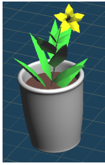
図 6. 花と鉢のオブジェクト

らないが、オブジェクトどうしの「めり込み」を検出しようと試みる攻撃である。しかし筆者らは、次の二点の理由からこの攻撃は困難であると考えている。