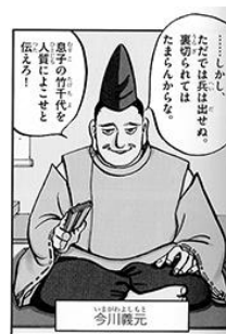
図4 (左下) 『学習まんが人物館織田信長』小学館, 2012