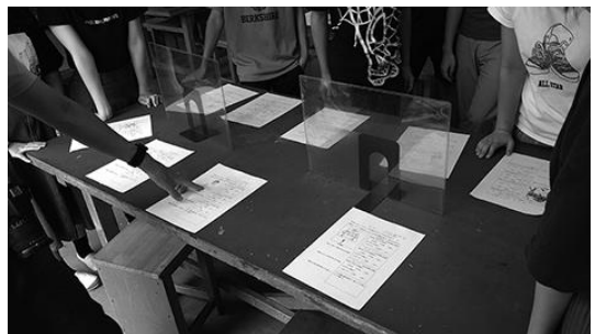
図13 全員での鑑賞の様子