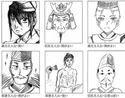
図 14 ワークシートに描かれたキャラクター「今川義元」