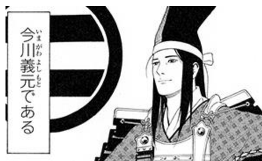
図8 『コミック版日本の歴史 57 戦国人物伝今川義元』ポプラ社, 2017