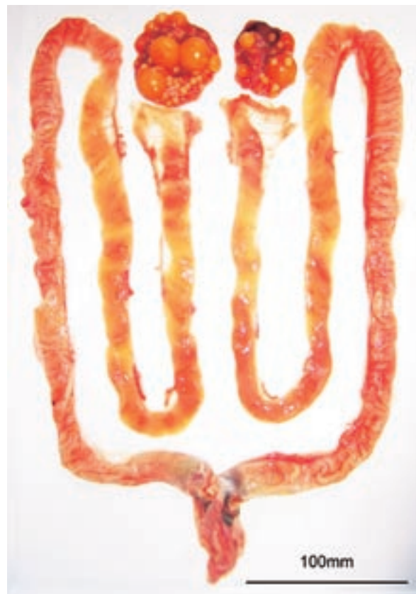
Fig. 3 Ovarian follicles and oviducts of the female. Oviduct length, 945 mm (left) ; 863 mm (right).

特定外来生物に指定されたカミツキガメの輸入と販売、繁殖は行われていない。そのため、幼体と判断された2個体は、野外で繁殖したものと判断した。本調査では、野外において卵や孵化後に残る卵殻は確認されなかった。しかし、千葉県佐倉市では、カミツキガメの卵が野外で確認されており、2008年6月12日には印旛沼に流れ込む高崎川の土手で、1クラッチ46個のカミツキガメの卵が発見され、その巣では9月19日から21日の間に13個体の幼体