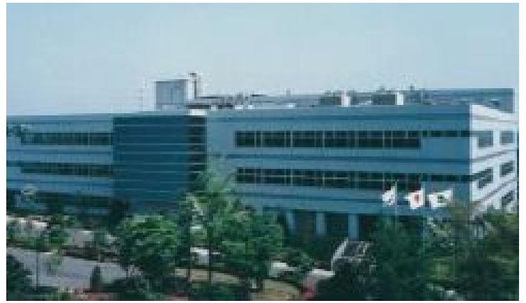
テイボー株式会社都田技術センター