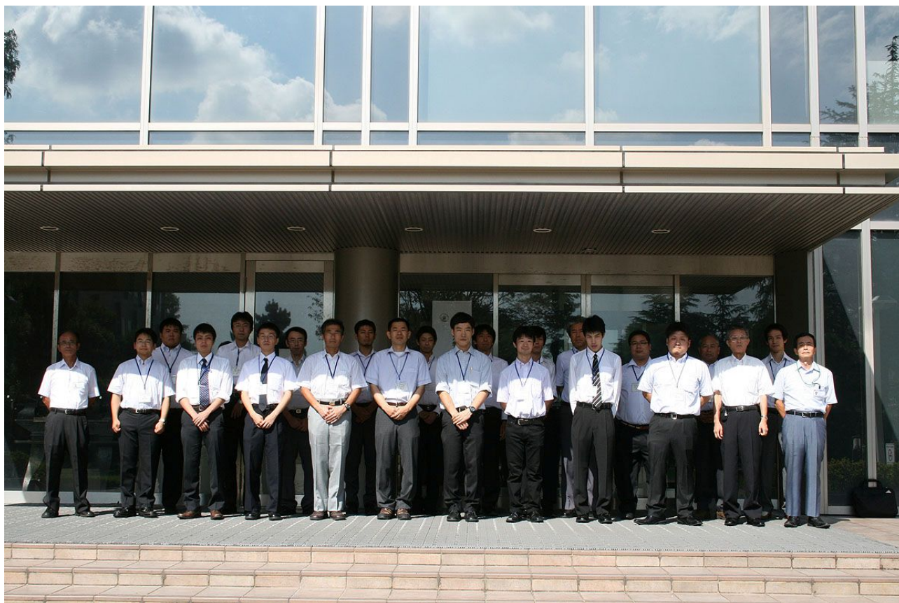
研修者全員の集合写真