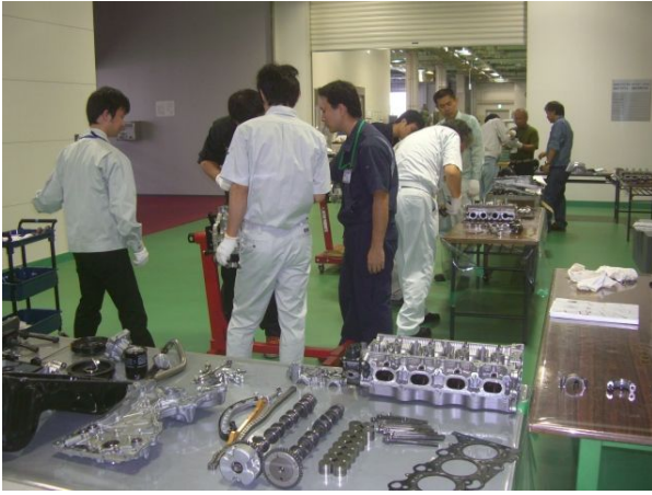
エンジン解析コース エンジン分解中