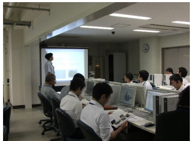
基本操作説明中（戒技術専門職員）