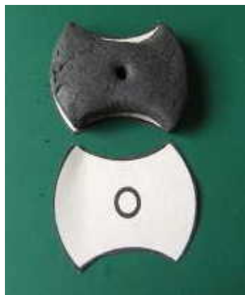
図4 電機子磁石型紙

その結果，本研究では，このフェライト系磁性粉体に，少量の粘土を添加したソフトフェライト磁石粘土を作成する。これを図4の電機子の型紙に載せて，電機子磁石を作る。これを，電気炉で，1000度以上の温度で焼結し，それに銅線を巻くと電機子磁石が完成する。