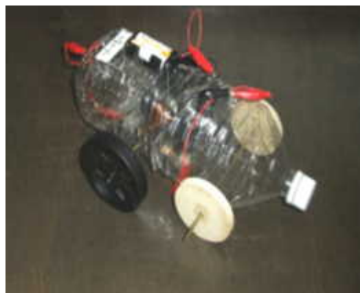
図5 「ペットボトルモータカー」

これを学校現場で実践すれば，環境に優しいエネルギー利用の観点で理科教育・技術教育の融合と科学技術的な環境教育への発展が図られる。このような研究は世界でもほとんど例がなく，日本の科学教育の先進性が国際的に注目され，22世紀に向けた新環境教育と言えよう。