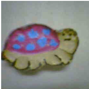
図1 手づくりハードフェライト磁石

次に図1の「手づくりハードフェライト磁石」を作成し、この磁石でモータが回転することを証明した。図1の磁石を表面がS極裏面がN極に磁化し、これを用いてもフレミングの左手で回転する新型クリップモータ教材を開発した。クリップモータも、星形などの回転残像が残るクリップモータ、かご形で回転する3D型クリップモータを開発し、研究結果を公表した。