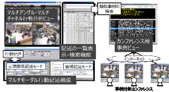
図3. カンファレンスシステム

行動観察システム (CODOMO-viewer: A viewer for Corpus-Oriented Development Observation from Multiple Objectives) を発展させ、コメントをWeb上に集約し、観点ごとや、事例ごとにコメントを付与及び、閲覧できる仕組みを実現した。本ツールを使った実践により、遠隔地の専門家の意見を収集し、独立性と分散性を担保したシステムとして意見集約に有効であることを示した。