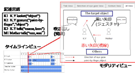
図2. 映像分析システム

物理的な観察可能なレイヤから、各種心的状況記述への段階的な行動記述スキームを導入し、エビデンスベーストな事典の深化成長を実現した。