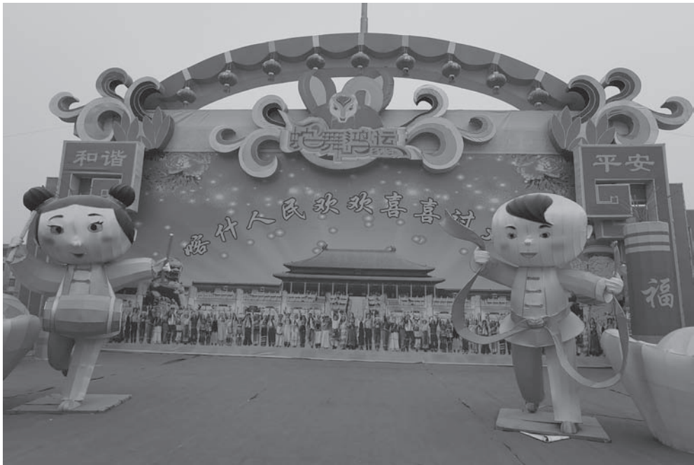
写真3 新疆ウイグル自治区カシュガルにある入植者中国人すなわち漢人たちの正月を祝う舞台。ウイグル的な色彩は完全に排除されている。2013年、楊海英撮影

ければならない」とも話した。また、共産党は漢人の政党だ、漢人は党と政府のあらゆる権力を掌握している、などとの不満をもイミンノフは漏らしていた。