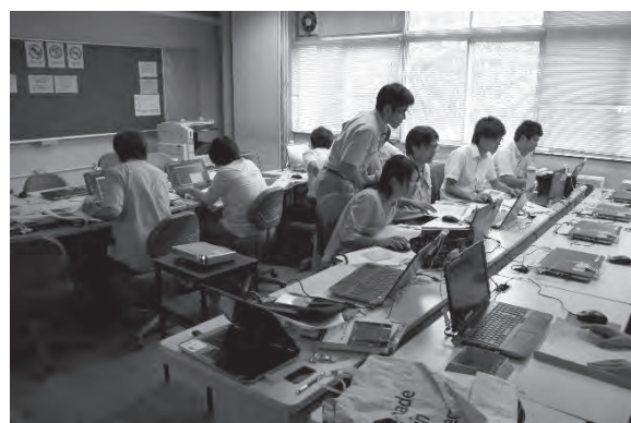
図 5-2 研修の様子