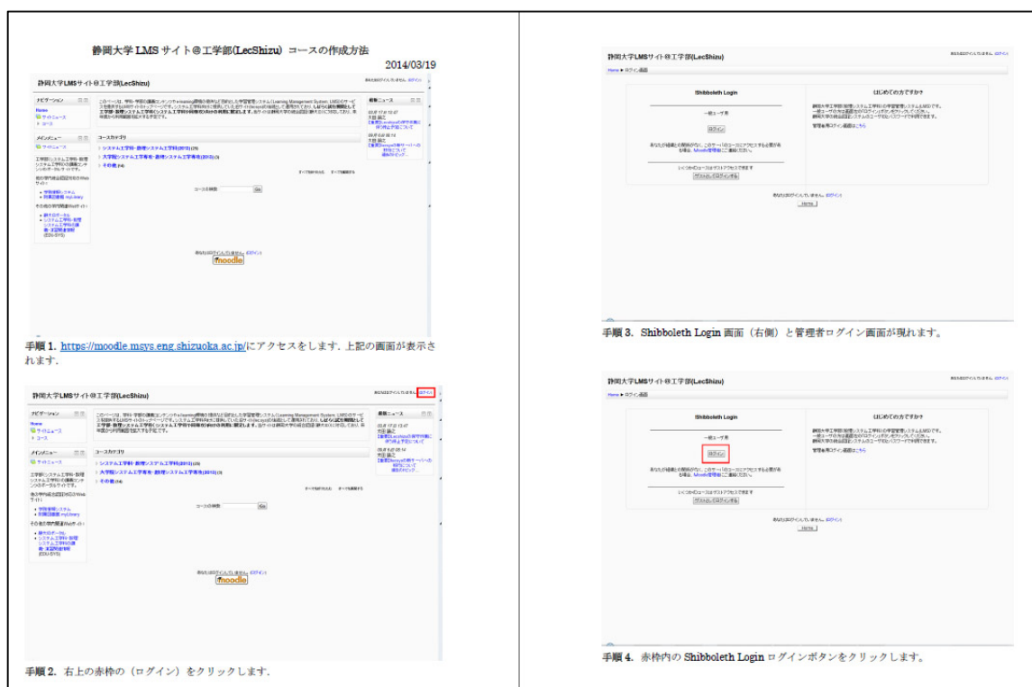
図 2-1 静岡大学 LMS サイト@工学部 (LecShizu) コースの作成手順マニュアル (一部)

あらかじめ LecShizu を使用する教員向けに、図と文章で構成されたコースの作成手順を示した「静岡大学 LMS サイト@工学部 (LecShizu) コースの作成手順マニュアル (図 2-1)」を作成しておき、LecShizu 上のニュースフォーラム (図 2-2) にアップロードをした。これによりニュースフォーラムに登録している教師はいつでもコースの作成方法を参照可能である。