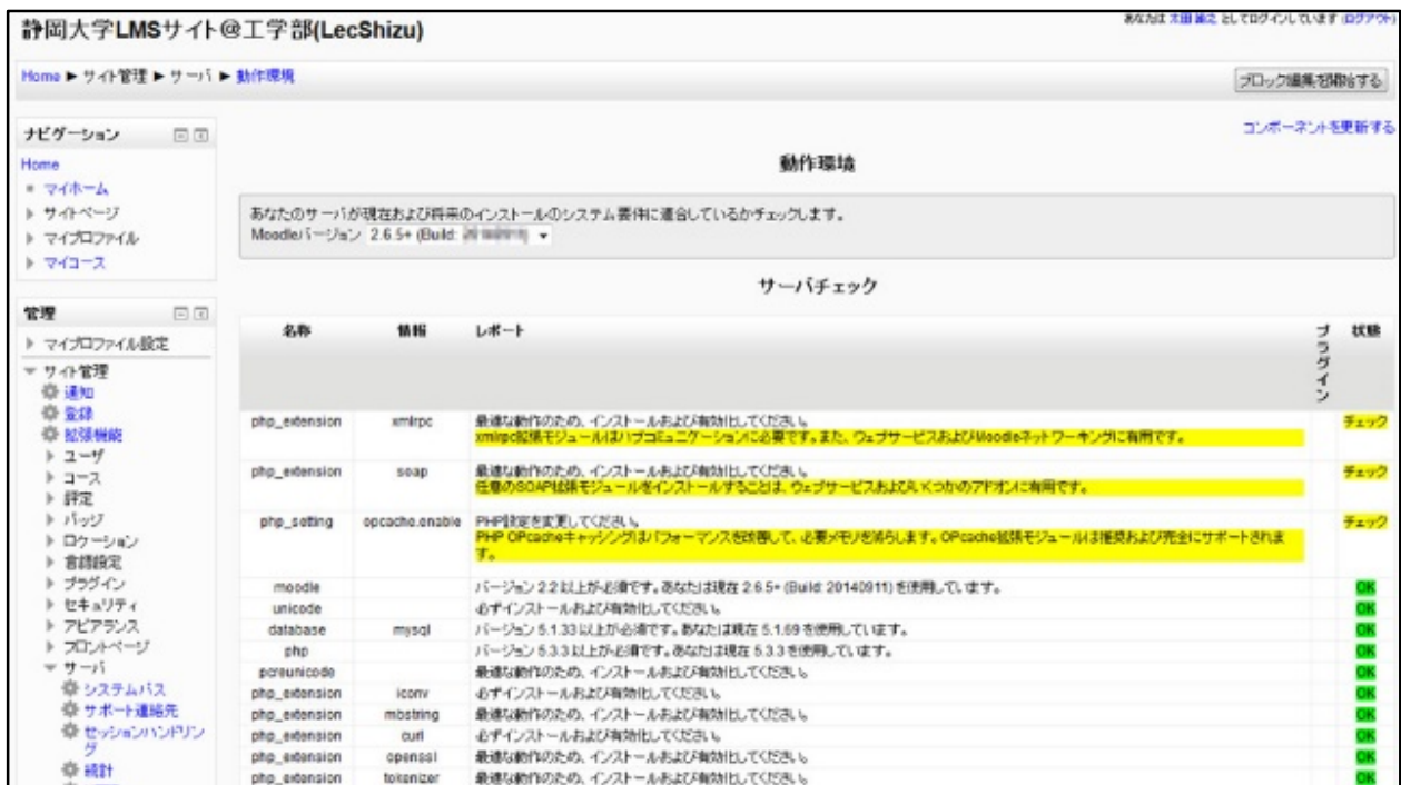
図 3-2 Moodle のサーバチェック画面