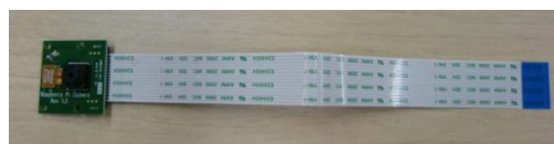
図3 カメラモジュール

RaspberryPi には図3に示す専用のカメラモジュール (画素数: 5M ピクセル) があり、簡易な設定のみで使用することができる。研修では、カメラモジュールの使い方から画像の配信機能を持つソフトウェアである mjpg-streamer を使ったブラウザ経由での画像の確認を行った。また、GPIO ピンに接続したスイッチを押すと静止画を撮影するプログラムを作成し、静止画の解像度を変化させて撮影を行った。