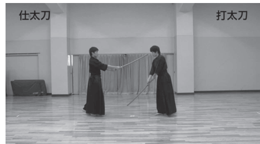
図1 日本剣道形の演武の様子（一本目）

日本剣道形とは、防具を着けずに木刀を用いて行う剣道における形稽古である。剣道形には十本の形があり、師匠役の「打太刀」と弟子役の「仕太刀」が対となって形の練習を行う（図1）。