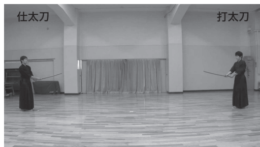
図 3 テロップ追加後の映像(剣道形一本目)