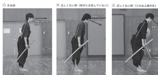
図4「互いへの礼」の手本例・正しくない例

このように用語集に図や解説を増やすことにより、解説内容の不十分さと図の不足という課題点を解決できると考える。