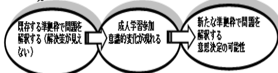
図1. 意識変革を促す成人学習

(2) 本研究で定義する成人学習とは、個人と社会の関係性を当事者が批判的な振り返りを通じ、習慣化された行為、思考等の枠(準拠枠)を変えていく学習である(常盤・布施, 2004)。