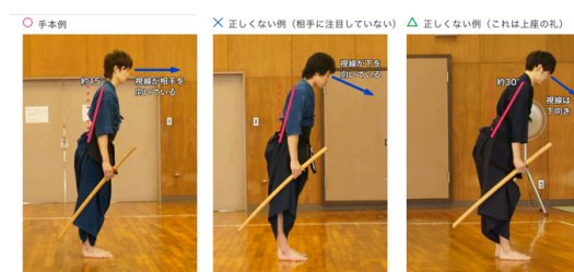
図4 手本例・正しくない例