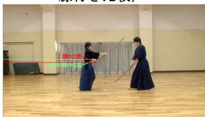
図 8 非同期型比較(腰ライン付き比較:初心学習者)

〔同期型〕図 7 左図のように映像内の上半分に手本、下半分に初心学習者による全体映像を配置し、同時に比較して見ることができるようにする。これも別々に撮影された映像であるため、三画面映像同様、時間伸縮効果を適用し動作を同期させる。