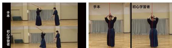
図 7 同期型比較(左:全体比較、右:正中線付き比較)