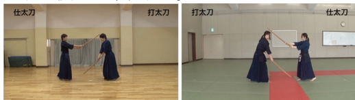
図5 全体映像(左:男性モデル、右:女性モデル)

【内容】学習対象となる動作について、最初から最後まで連続して全体を把握できる映像である。ここでは、手本による各形の演武で、打太刀および仕太刀の所作と位置関係を理解できるように真横から撮影する。